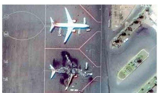
खार्ट्म : येथील विमानतळावरील हवाई हल्ल्यात अनेक विमाने नष्ट झाली.

संयुक्त राष्ट्रांनी दिलेल्या माहितीनुसार, सुदानमधील सशस्त्र संघर्षात आतापर्यंत १८५ जणांचा मृत्यू झाला असन अठराशेहन अधिक जण जखमी झाले आहेत. सुदानची राजधानी खार्तमसह अनेक शहरांमध्ये जोरदार धुमश्चक्री सुरु असून रस्त्यांवर अनेक मृतदेह पडलेले आहेत. या ठिकाणी अद्यापपर्यंत पोहोचता आलेले नसल्याने मृतांची संख्या वाढण्याचा अंदाज आहे.