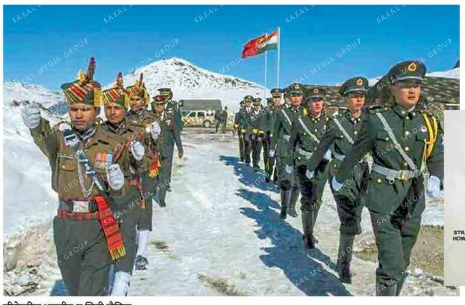
सीमेवरील भारतीय व चिनी सैनिक.